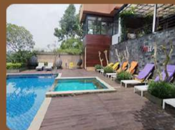
Villa Canella - Nongkojajar