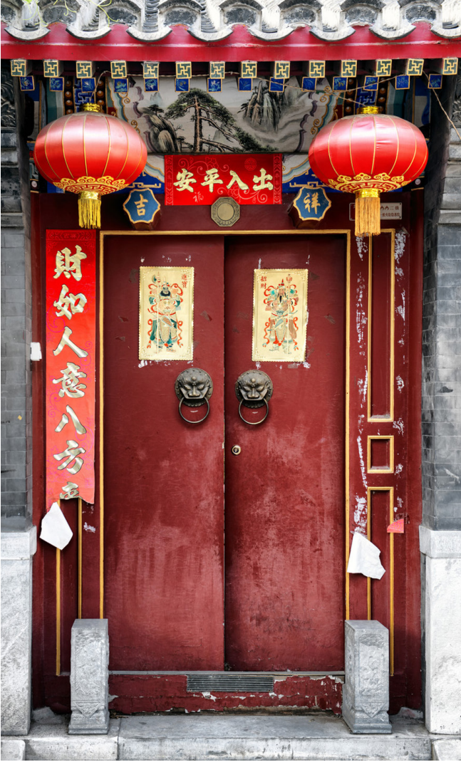
Ilustrasi gambar kertas merah pada pintu

Ada beberapa legenda mengenai asal-usul Tahun Baru Imlek. Salah satunya menceritakan tentang keberadaan monster yang bernama Nian. Nian adalah monster dengan kepala panjang dan tanduk tajam. Nian tinggal jauh di dalam laut sepanjang tahun dan hanya muncul setiap Malam Tahun Baru untuk memakan orang dan ternak di desa terdekat. Oleh karena itu, pada malam tahun baru, orang-orang akan mengungsi ke pegunungan terpencil untuk menghindari celaka dari monster tersebut. Orang-orang hidup dalam ketakutan akan